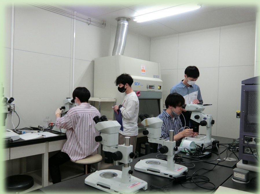
試験官が横に付き作業手順をチェックしました

この検定は、発生工学の基礎を学んでいるかを判定し、合格者は生殖工学における実験手法(初級)が身につけていることを証明するものです。